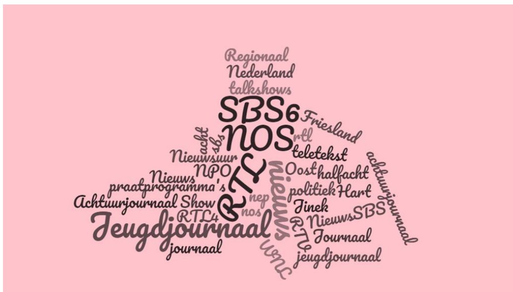
Figuur 1, Word cloud voorkeur nieuwsbron (medium), laaggeletterde respondenten

De laaggeletterde respondenten volgen het nieuws op TV vooral via het NOS Journaal en het nieuws op RTL4, ook Hart van Nederland op SBS6 wordt vaker genoemd (zie ook figuur 1). 14 Een aantal laaggeletterde respondenten geeft aan dat zij het NOS Jeugdjournaal kijken wanneer zij het nieuws via andere bronnen niet goed begrijpen: "In het Jeugdjournaal wordt het allemaal duidelijk uitgelegd. Als ik die heb gezien, is het achtuurjournaal makkelijker te volgen. Want ik vind het achtuurjournaal lastig te volgen. Te veel moeilijke woorden."