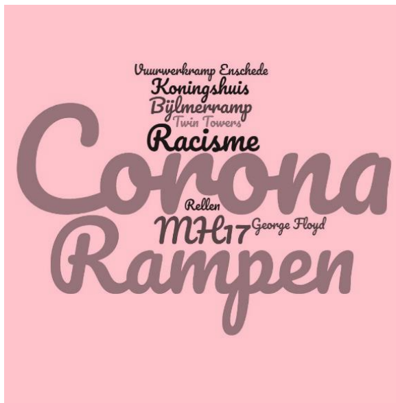
Figuur 2, Word cloud indrukwekkend nieuws (inhoud), laaggeletterde respondenten